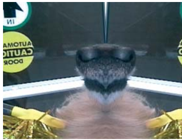
Bucket/realización artística Claude Wampler (Estados Unidos) (18 min.)

En un piso neoyorquino Bucket expone con crudeza, humor y ligereza, fragmentos de la vida de una pareja y explora el espacio de lo callado y los momentos absurdos de la convivencia. Director de escena, artista-performer y video creador, Claude Wampler está en perpetuo equilibrio entre las artes plásticas y el teatro, entre la instalación y la performance. Con un gusto marcado por el humor y la controversia, sus creaciones abordan ficciones que exploran la cara oculta de los decorados, los de la vida cotidiana o los del universo de las artes y del espectáculo.