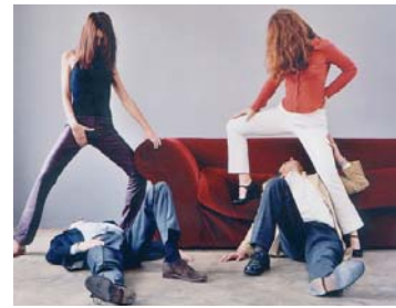
Pornographie/ performance de Edouard Levé (Francia) (25 min.)

La performance Pornographie es una extensión de una serie de fotografías del mismo nombre en las que los modelos, vestidos e inexpressivos, representan escenas sacadas de revistas pornográficas. Como el objeto del deseo está escondido, la obscenidad de la escena se disuelve dando lugar a una coreografía tan explícita como desfasada. La pornografía, convertida en una ecuación de gestos, revela su potencial coreográfico.